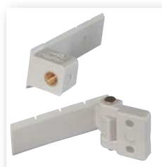
Clips klein, groß, beweglich Clips small, large, movable