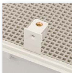
Clips klein, groß Clips small, large